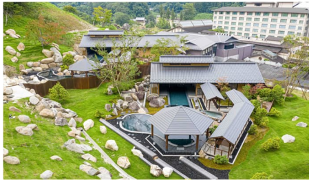
母畑温泉 八幡屋 帰郷邸