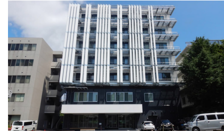
Tokai Open Innovation Complex