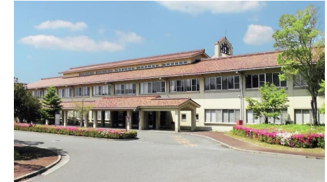
吉備高原医療リハビリテーションセンター