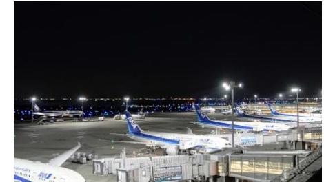
航空灯火・空港エプロン照明灯